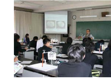
大学教授によるガイダンス