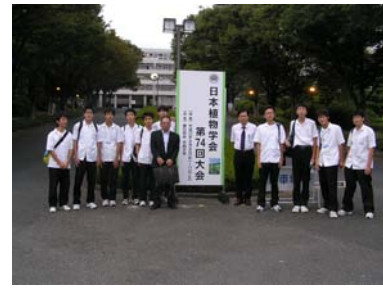
高校生ポスター発表会参加