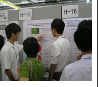
ポスター発表の様子